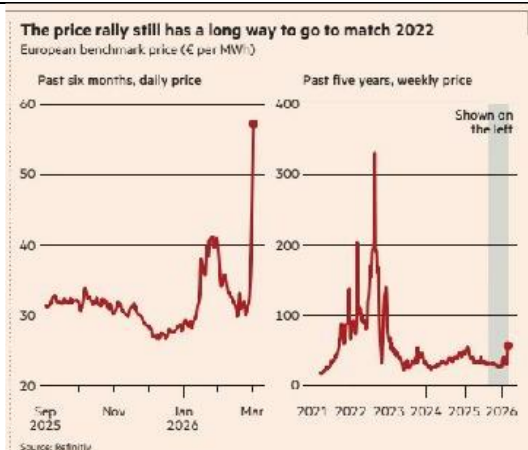
Infographie : Financial Times